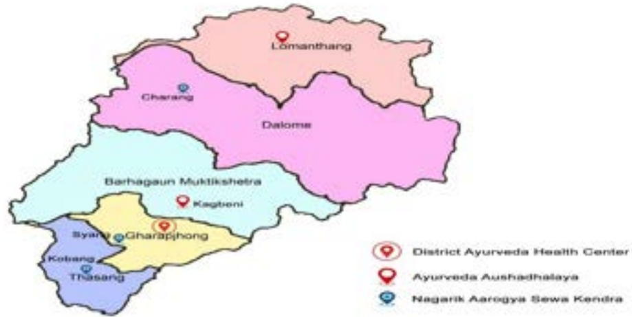
चित्र नं. १ जिल्लामा रहेका सरकारी आयुर्वेद संस्थाहरु

३) नागरिक आरोग्य सेवा केन्द्र, चराड, ल्हो घेकर दामोदरकुण्ड गाउँपालिका